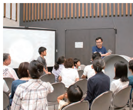
サイエンスカフェ